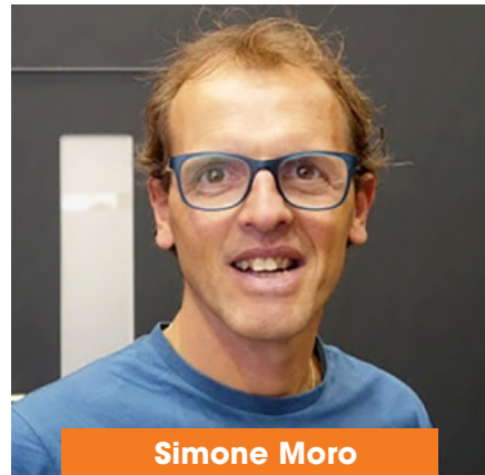
Simone Moro Zimní výstupy v horách nad 8000 metrů

Nahlédnutí do prvopočátků vysokohorského skialpinismu. Dal by se výstup na 7500 m horu zvládnout na lyžích? Otázka, položená v létě 1969 při setkání Akademického alpského klubu v Innsbrucku, byla předmětem dlouhé diskuse. Dalo by se takového výkonu dosáhnout bez kyslíku?