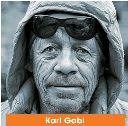
Karl Gabl Prvosjezd Nošaku (7492 m) na lyžích, červenec 1970

Přednáška světoznámého extrémního horolezce je o houpaté cestě světem dvou bratrů známých jako „Huberbuam“. Je to současně oslava svobody – intenzivní, vášnivý a motivující, ale také přemýšlivý a současně tragický příběh plný otázek a odpovědí na to, co děláme a proč to děláme