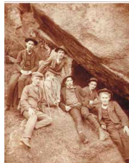
Členové Lezeckého kroužku Prachov (1907)

V létě 1907 cvičili v dnešní oblasti U Mouřenína a nebo v nedalekém Babinci na jižním okraji skal. Některé jsou vidět ze silnice mezi Jičínem a Mladou Boleslaví. Jsou tam skalky od několika málo metrů až po ty 12metrové i vyšší. Je jasné, že výstup na Mnicha (35 m), byl lákavý. V této vrcholové knize je i první dochovaná fotografie lezců a dlouho se nevědělo, kde byla pořízena. Protože ale rád prolézám neznámá místa, zhruba před pěti lety při jedné procházce na Prachově jsem se otočil a zůstal stát v němém úžasu. Shledal jsem šikmou skalku a kámen, na kterém dva z těch šesti borců seděli. Uvažoval jsem, proč se fotili zrovna na takto neatraktivní ploše. Vzhledem k tomu, že se psal rok 1907, tak kudy se vlastně chodilo do Prachovských skal? Tehdy nebyla Turistická chata. A jak asi vypadala výbava fotografa? Byla to zřejmě velká a těžká dřevěná krabice, se kterou se vláčel na zádech. Zkoušel jsem proto hledat nedaleko tehdejšího Penzionátu společenstva jičínského odboru turistů, což je dnešní Hotel Šikmá věž. A úvaha to byla správná. Tenhle kámen je tedy v Babinci, bohužel v oblasti běžnému návštěvníkovi zapovězené. Leží totiž mimo značené trasy. Nicméně je v těsné blízkosti přístupové cesty ke skále, která se ale téměř nelezle.