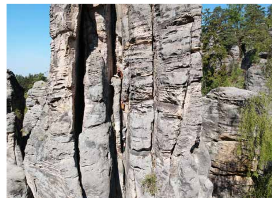
Východní komín na Mnicha. Prvovýstupci z LKP tudy vystoupili 4. 10. 1907.

My jsme ten snímek zdigitalizovali a detailně prozkoumali. Je na něm šest borců navázaných na jedno lano jako při chůzi po ledovci, ovšem nikoli v horizontální, nýbrž ve vertikální poloze