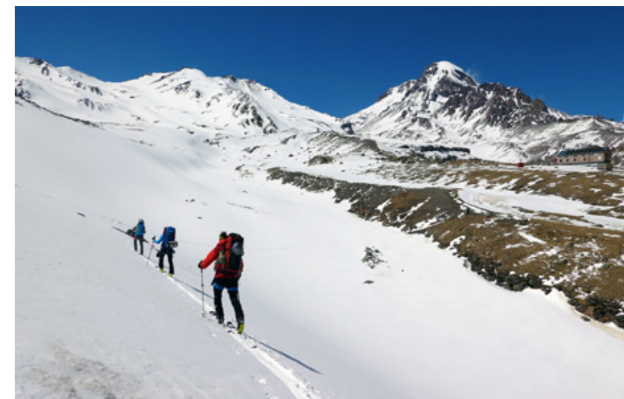
Sněhu je málo, než obvykle bývá na začátku května, ale na pěknou jízdu dolů to stačí