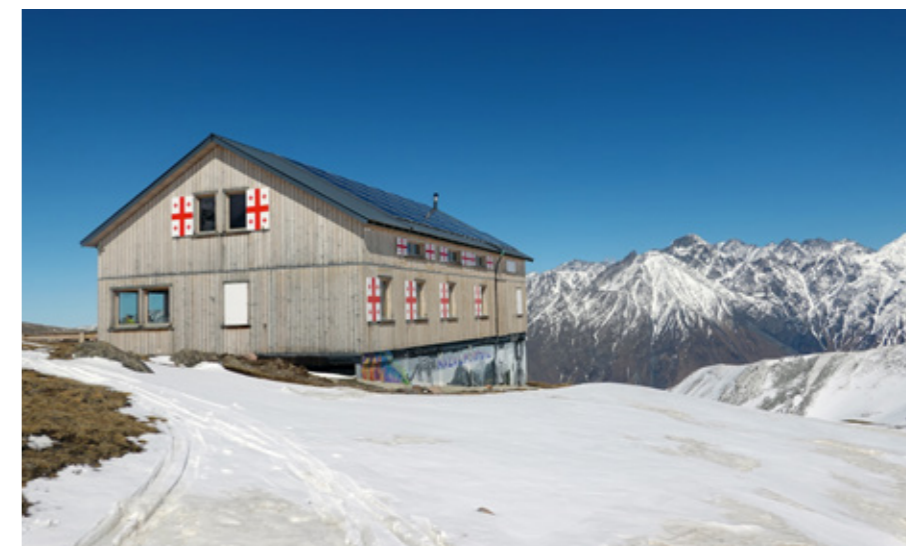
Chata "Altihut" (3014 m)