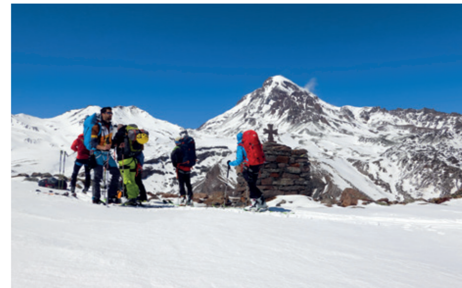
Oddechnutí po prvním stoupaní asi kilometr před chatou "Altihut" (3014 m)