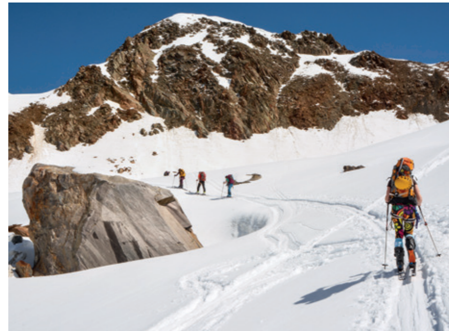
Na chatu se dá vystoupat z několika směrů. Chatařka Katka nás vedla z údolí Kaunertal.