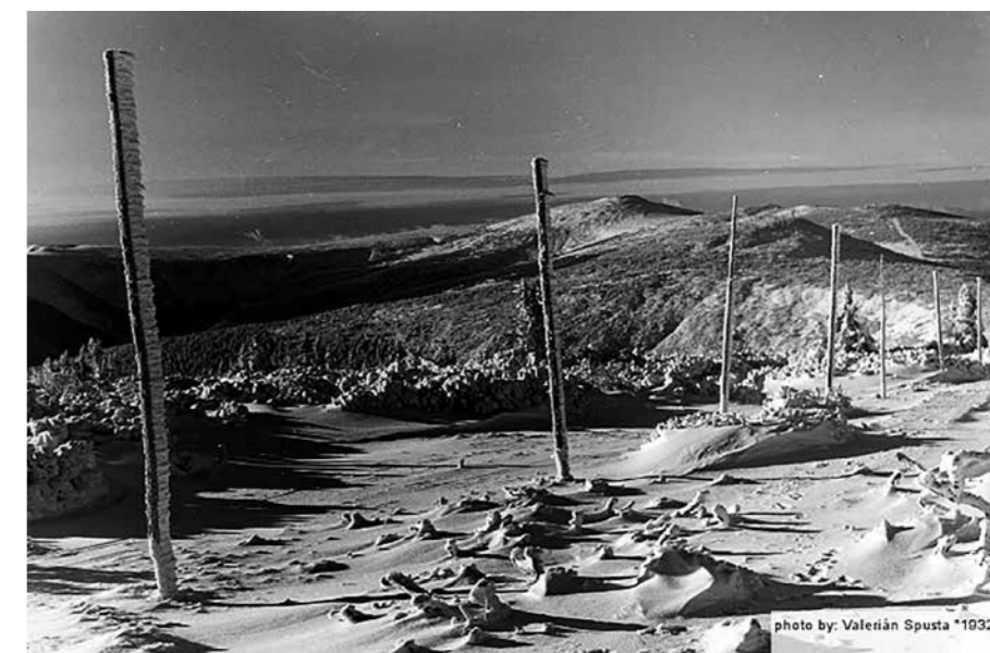
Krkonoše v roce 1922