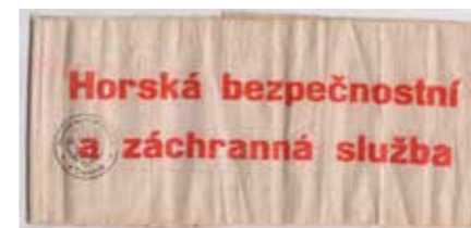
Připravený znak a páska na rukáv